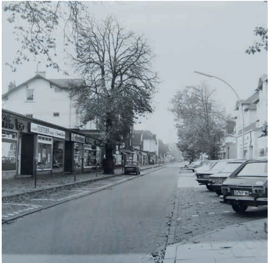
Waitzstraße, 1973, Anfang, Blick nach Westen

Vitrine anzubauen, eine Lücke, um sie durch einen Obst- und Gemüsegeschäft, durch ein schmuckes Textil-Paradies oder durch eine Meierei mit allem Drum und Dran auszunutzen, und ehe man sich's versieht, hat die WeKa-Konditorei (stand für die Initialen W. K. des Betreibers Werner Kleinsteuber) das Jubiläum ihres einjährigen Bestehens hinter sich gebracht. Wenn jetzt aus der Ulmenstraße eine Waitzstraße geworden ist (1950), entwickelt sich diese Geschäftsstraße langsam, aber mit einer gewissen Zielstrebigkeit zu einer Geschäftsstraße erster Ordnung. Unentwegt wird weiter an- und ausgebaut. Kaum hatte August Blunk seinen Laden hier aufgegeben, um sich auf sein Kolonial- und Fettwarengeschäft in der Reventlowstraße zurückzuziehen, waren schon Bauhandwerker tüchtig an der Arbeit, noch einen Schlachterladen einzurichten. Der Großschlachter und Wurstwarenfabrikant Emil Friß läßt ihn in der jetzigen Waitzstraße (Nr. 7) mit einem beachtlichen Kostenaufwand ausbauen und wird ihn demnächst eröffnen. Schräg gegenüber (Nr. 14) sind zur Zeit Arbeiter mit allen verfügbaren Geräten