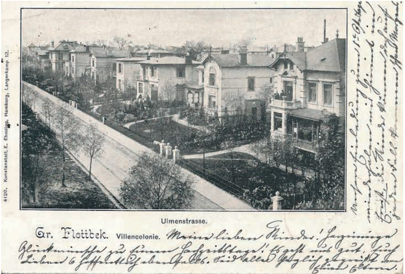
Ulmenstraße, 1900, heute Waitzstraße mit vorgebauten Läden