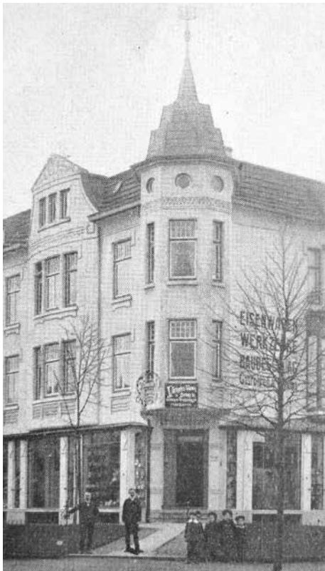
Ulmenstraße 2-4, 1905 circa, Fa. Burmeister (Waitzstraße)