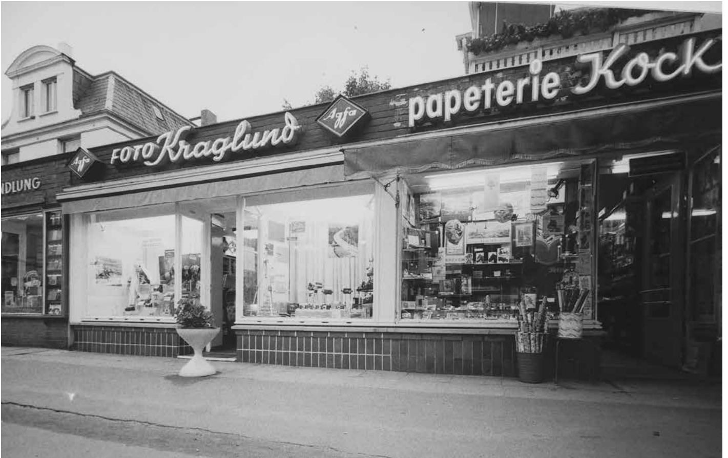
Waitzstraße 22, 1973, Papeterie Kock, Foto Kraglund Buchhandl. Harder (C) Archiv Flottbek-Othmarschen: Heute (Buchhandlung Harder, Textilreinigung Latifi, Großmann & Berger)