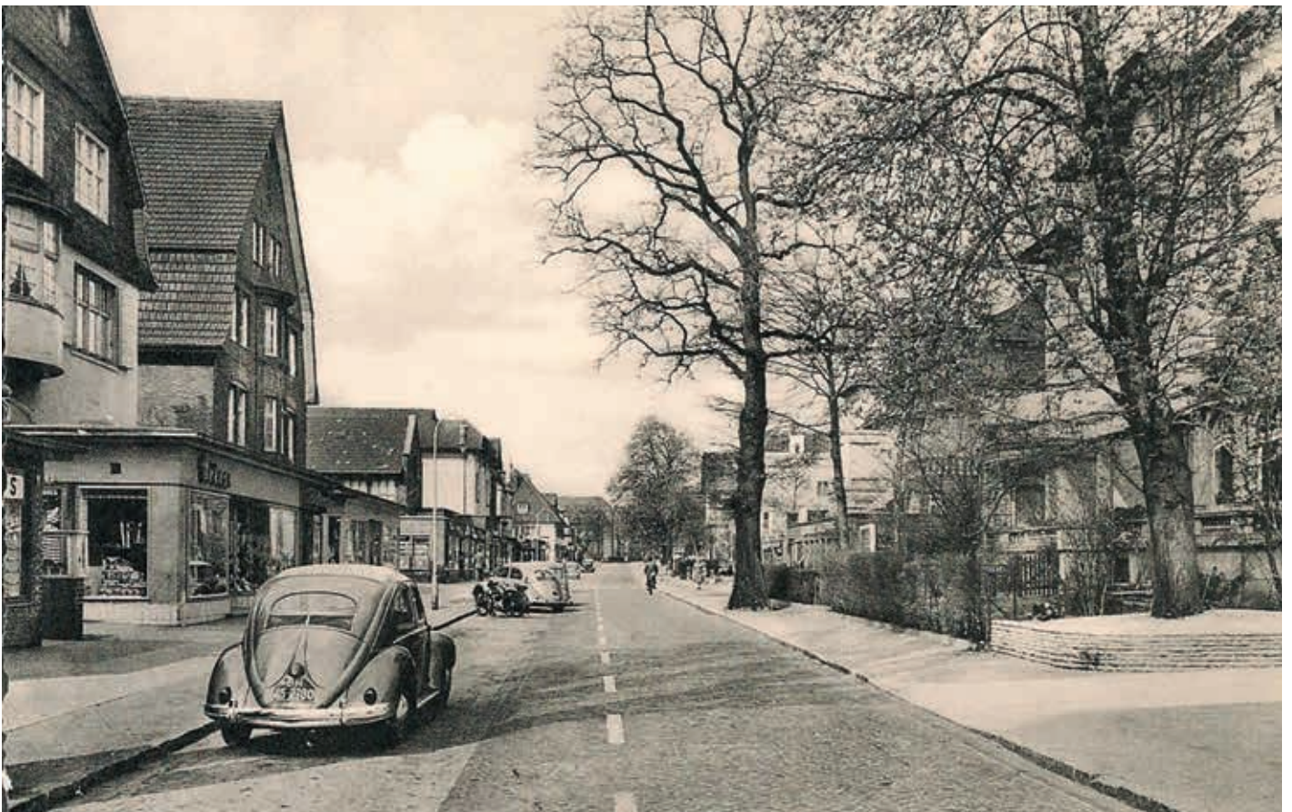
Waitzstraße vorderer Bereich 1952